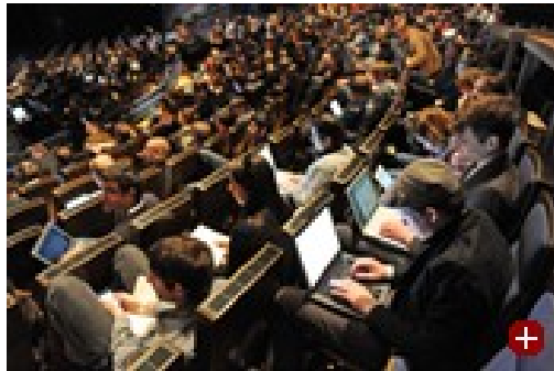
Rastlos auf der Suche nach dem nächsten großen Ding: Teilnehmer der Blogger-Konferenz "re:publica"

18. Februar 2010 Früher reichte es aus, wenn eine Firma Produkte herstellte, sie bewarb, in den Handel brachte und verkaufte. Wenn aber eine Firma 2003 im Internet vorn sein wollte, musste sie sich beim Netzwerk „Friendster“ engagieren; 2004 konnten Dax-Konzerne ohne Blogs nicht mehr effektiv kommunizieren, 2005 sollte man sich mit der koreanischen „Cyworld“ beschäftigen, 2006 verlangten die Kunden nach Podcasts, 2007 galt es, Second Life zu erobern,